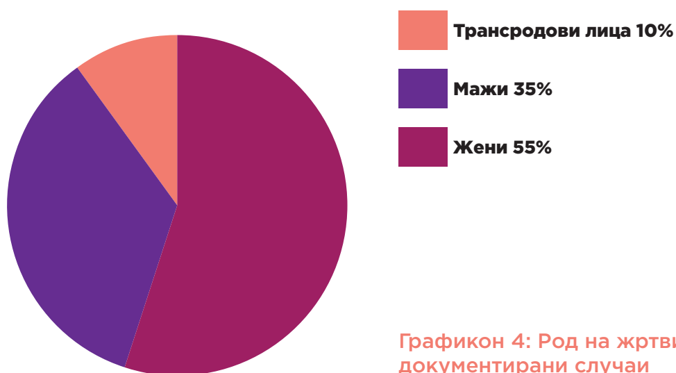
Графикон 4: Род на жртви на повреди на права од документираните случаи

Во документираните случаи жртви се 50 жени, 32 мажи, 9 трансродови лица и 32 деца. Децата се главно (индиректни) жртви во случаите на родово засновано и семејно насилство. Жените доминираат како жртви во случаите на родово засновано и семејно насилство и во повредите на права од работен однос, додека мажите во повредите на здравствени права, каде доминираат геј мажи што живеат со ХИВ, права во полициска постапка и социјални права, каде доминираат Роми. Трансродовите луѓе се најчесто жртви на родово засновано насилство, повреди на права од државни органи, полиција и социјална заштита. Од овие податоци видливи се родовите димензии на семејното насилство и насилството во интимните врски. Кај трансродовите луѓе, насилството се случува поради родовиот идентитет и/или сексуалната ориентација, додека останатите случаи се главно случаи на дискриминација во различни области врз основа на родов идентитет.