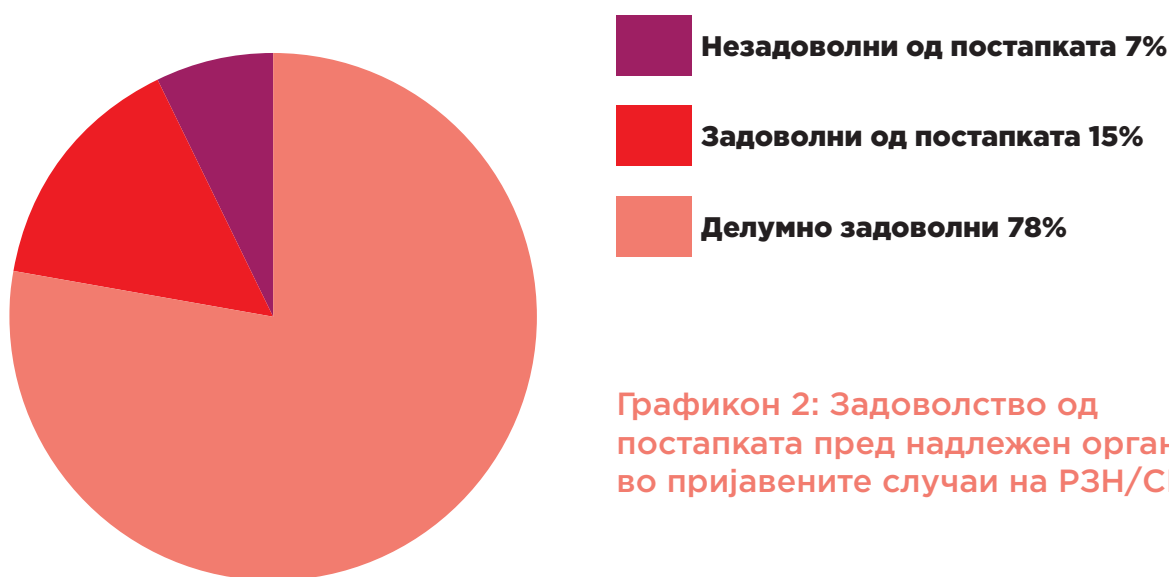
Графикон 2: Задоволство од постапката пред надлежен орган во пријавените случаи на РЗН/СН

Од случаите кои се пријавени пред надлежни органи, давателите на услуги во 6 случаи известуваат дека се задоволни бидејќи се решил проблемот, во 5 случаи не се задоволни од постапувањето, а во повеќето, 16, се делумно задоволни од постапувањето на институциите. Но, во случаите каде е документирано задоволство од постапката не значи дека органите постапиле целосно согласно закон, туку дека се решил проблемот на жртвата.